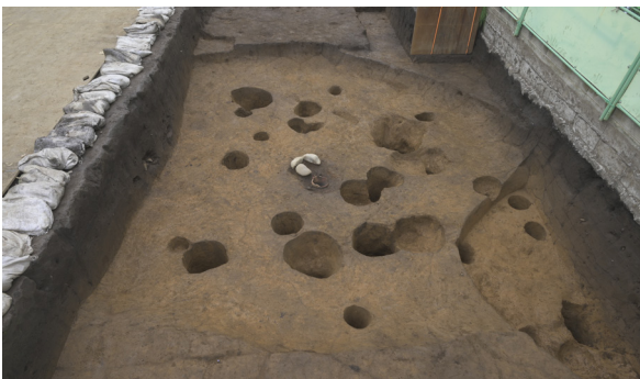
写真3 勝坂1式期のSI016(北から)