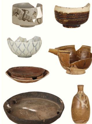
陶磁器類 (下宿内山遺跡出土)

下宿内山遺跡は江戸時代の農村の遺跡で、昭和 50 年代に発掘が行われました。華やかな大名屋敷や大都会江戸ではなく、村落を大規模に発掘する例は、多摩ニュータウン遺跡群を除くと現在に至るまでも希少です。まして江戸時代の考古学的研究が現在ほど盛んでなかった黎明期に行われたという点で、極めて革新的な調査でした。掘り出された遺物からは、当時の景観や人々の生活が浮かび上がります。