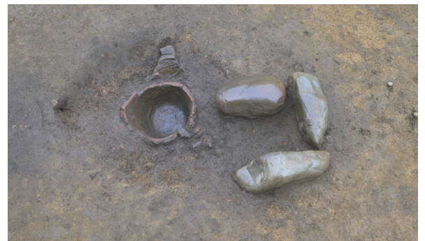
写真4 SI016の炉(南西から)