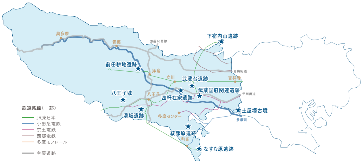
展示で紹介する多摩の遺跡の位置

武蔵台遺跡は東京都最古級の旧石器が出土した、研究史上も著名な遺跡です。立川ロームX層出土の石器類は約35,000-36,000年前のものと推定されています。アフリカで発生したホモ・サピエンスはその後世界