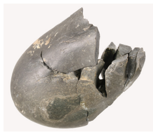
石器接合資料 (武蔵台遺跡出土)

中に進出し、約 38,000 年前に日本列島に到達したとされます。武蔵台遺跡から出土した旧石器の年代はこの年代と近く、この地域に到達した人類集団がほとんど残したものと考えられます。これほど古い石器群は全国的に見てもまだ少なく、その内容の豊富さからも、日本列島の後期旧石器時代の始まりを考える上で重要な資料と位置づけられてきました。小さな石器たちの向こうに見える「東京」ひいては「日本」のはじまりという大きな物語に思いを馳せてみて下さい。