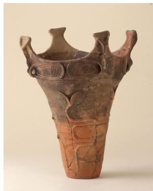
阿玉台式深鉢 (滑坂遺跡出土)

横浜線の八王子みなみ野駅の近くにあった滑坂遺跡は、縄文時代中期の環状集落です。縄文時代中期は大規模な遺跡が多く見つかる、関東縄文の最盛期とも言われる時代。当センターの展示室にも多摩ニュータウンから出土した中期の土器は多く並んでいますが、今回は同じ中期でも常設展示に並んでいるものとは異なる形態の土器たちを選びました。これぞ「縄文」というダイナミックな造形の土器たちは縄文好きのみなさまに必ず喜んでいただけたらと思います。