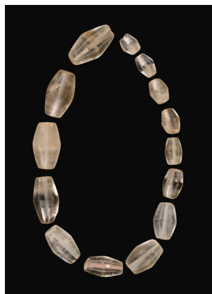
水晶製切子玉 (四軒在家遺跡出土)

多摩川中流域に存在する 7 世紀の古墳群から、直刀や勾玉、首飾り等を展示します。当時貴重だったガラスや金属、水晶等を使って作られた装飾品類は古墳に眠る有力者の権威を物語ります。7 世紀は多摩川中・上流域で群集墳 * が盛んに造営される時期で、本遺跡もその一つです。畿内から与えられ