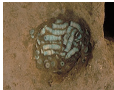
写真2 銭貨出土状態