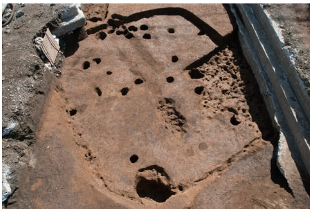
弥生時代後期の住居跡 (SI9)

今回の調査地点は、田端高台通り商店街に面した閑静な住宅街の一角にあり、山手線の路線からは至近距離です。調査は6月に始まり12月をもって終了しましたが、弥生時代後期から平安時代にかけての竪穴住居跡22軒と、掘立柱建物の柱穴や土坑・ピットなどを確認・記録しました。時代が判明した住居跡は、弥生時代後期が7軒、古墳時代後期が3軒、奈良時代から平安時代にかけてが10軒です。調査後は整理作業に入り、来年夏に報告書を刊行する予定です。（小島正裕）