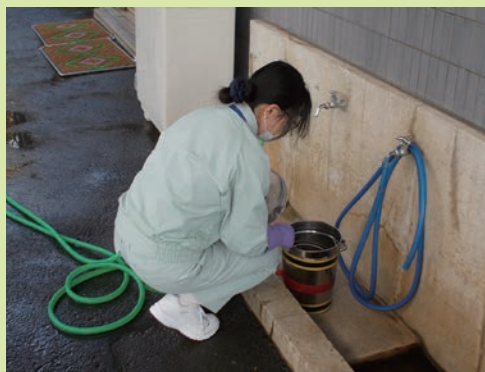
喫煙所の灰皿（缶）を洗う

苦手といいいながらも、毎日灰皿（缶）内の吸殻を綺麗にしています。作業の時間帯がちょうど職員の喫煙時と重なってしまうことがあるらしく、工夫してやっているそうです。（福田敏一）