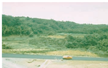
写真1 遺跡遠景写真