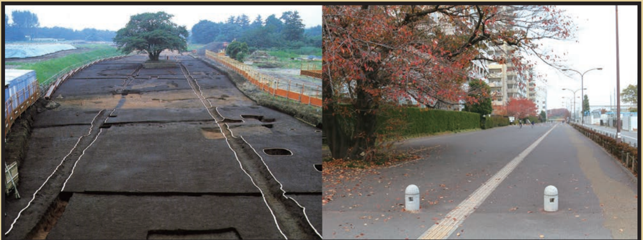
写真1：発掘調査によって現れた東山道武蔵路跡。道の両脇には溝（側溝）が掘られている（写真左）。調査終了後、遺構を残したまま上に舗装が行われ、現在は遊歩道として整備されている。舗装材の色で側溝の跡が示されており、古代の道路跡の様子を今でも見ることが出来る（写真右）。調査前からあった桜の木は現在も残されている。

現在もこの道路跡は遊歩道として整備されており、復元展示施設や説明板もあります。南方の武蔵国分寺跡からも近いので、古代の道を歩きながら歴史散歩をするのも面白いでしょう。（武内 啓）