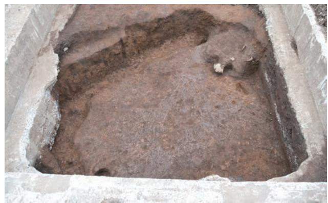
平安時代の住居跡 (SI11)