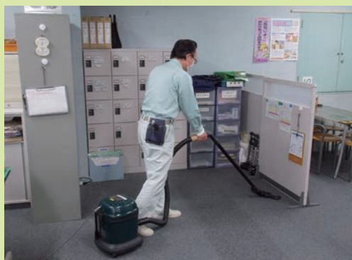
職員事務所を綺麗にする

を手早くしかも丁寧に終了し、次に2階の玄関や展示ホール、体験コーナー、廊下などの清掃を入念に行います。来館者が使用するこの空間は特に清潔を保つよう心がけているとのことでした。それと並行して1階や地下1階、また全館のトイレなどの清掃も、それぞれ分刻みで分担して行います。3人全員が、「午前中は本当に忙しい」と口をそろえる所以です。ちなみに、トイレの清掃は一日に3回行っているそうです。