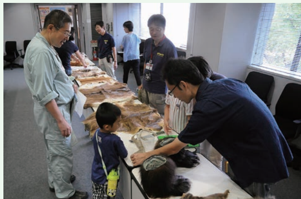
これはアオダイショウの抜け殻? (当センターにて)

陽が完全に沈んだ頃、バットディテクターを使って、野生のアブラコウモリの会話を聞くことができました。強風などの気象条件によっては聞けないこともあるそうです。最後は、ヘビ（アオダイショウ）に触れて、この日のイベントは終了しました。