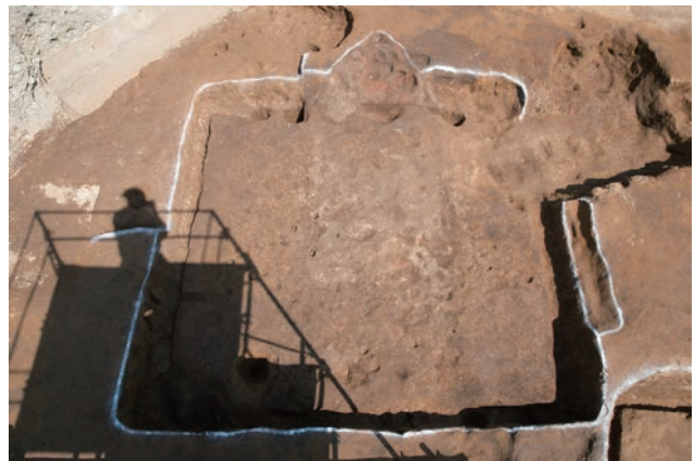
奈良時代の住居跡 (SI14)