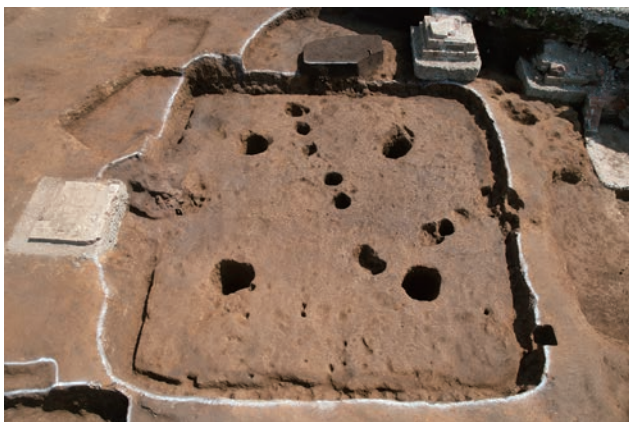
古墳時代後期の住居跡 (SI16)