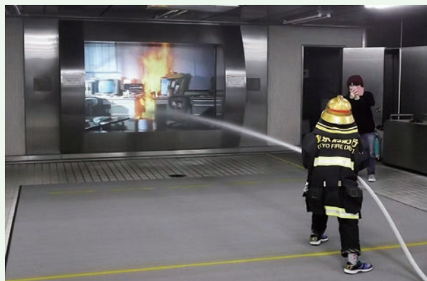
消火! (立川防災館にて)

これらの企画は、当センターの新たな試みとして、異なる業種の施設2館と共同で企画・開催したものです。実際に開催してみて、参加者に満足してもらえたところもあれば、新たに見えてきた課題もありました。これらを今後の企画に生かせるよう、取り組んでいきたいと思えます。(小西絵美)