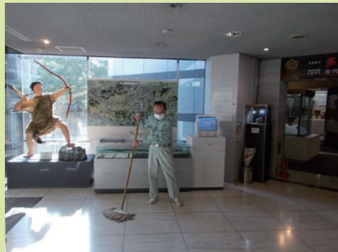
ホールの床を磨き来館者を待つ

作業は朝8時、まだ大方の職員が出勤していない時間にはじまります。2階と3階の職員事務所