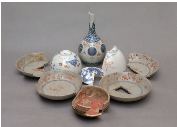
上絵付で色絵文様が描かれたやきもの（新宿区新小川町遺跡出土）

下の写真に掲げた陶磁器は、本焼き後に釉薬の上から文様を描いた「上絵付」のやきものです。とくに注目したいのは、写真手前の陶器碗と左右4枚の磁器皿です。瀬戸・美濃産の腰鑄碗は文様を持たないのがふつうですが、内面には赤色顔料が付着し、外面口縁下には赤色で幾何学文様が加飾されています。また肥前産の磁器染付皿は灰白色素地の厚手の五寸皿で、「くらわんか」と呼ばれるこのタイプの