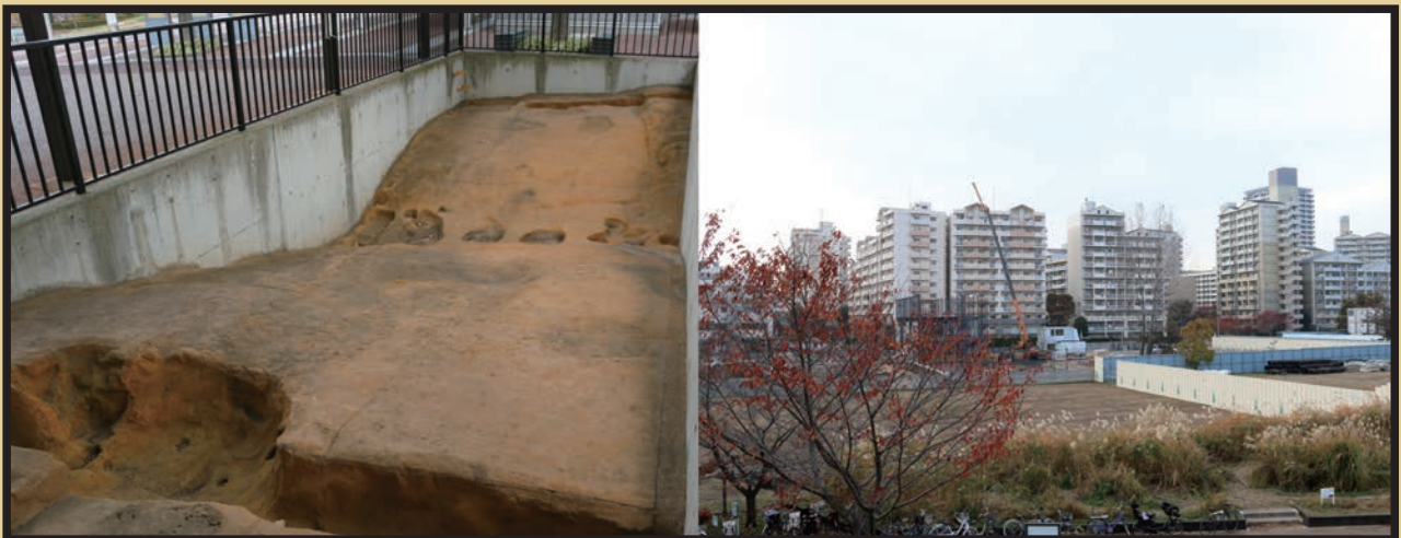
写真2：遊歩道の北方には、型取りされた道路跡の復元を展示しているスペースがある（写真左）。武蔵国分寺公園から西国分寺駅方面を望む（写真右）。現在も造成工事が行われており、奥のマンション群と造成地の間に遊歩道がある。