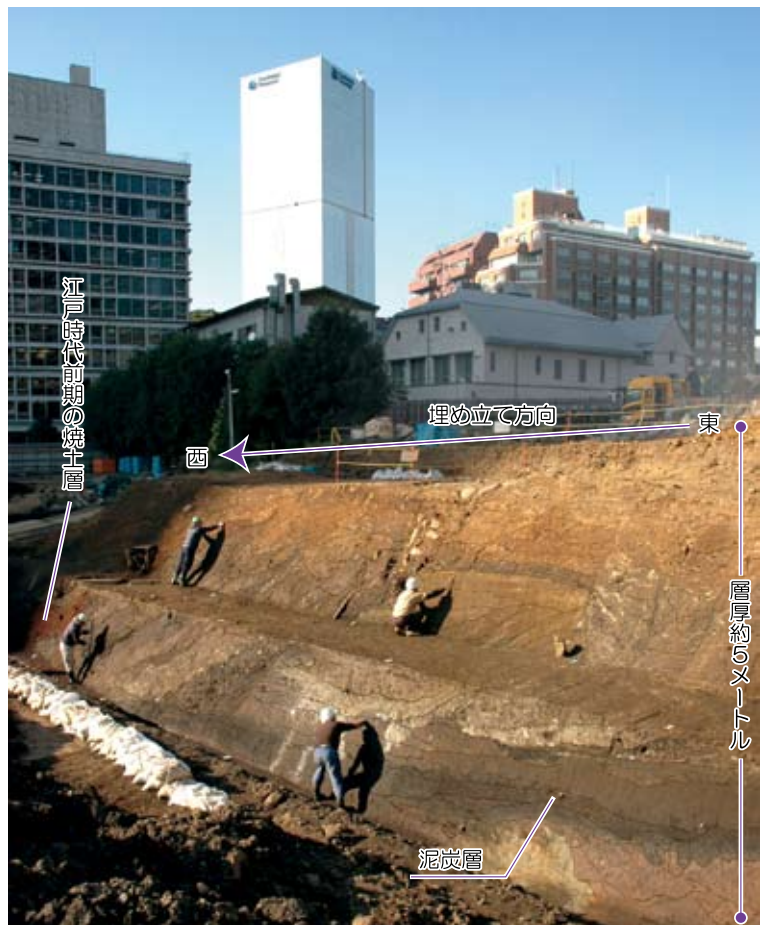
8 埋め立て土層（衆議院議員会館地点） 南東から北東方向を望む