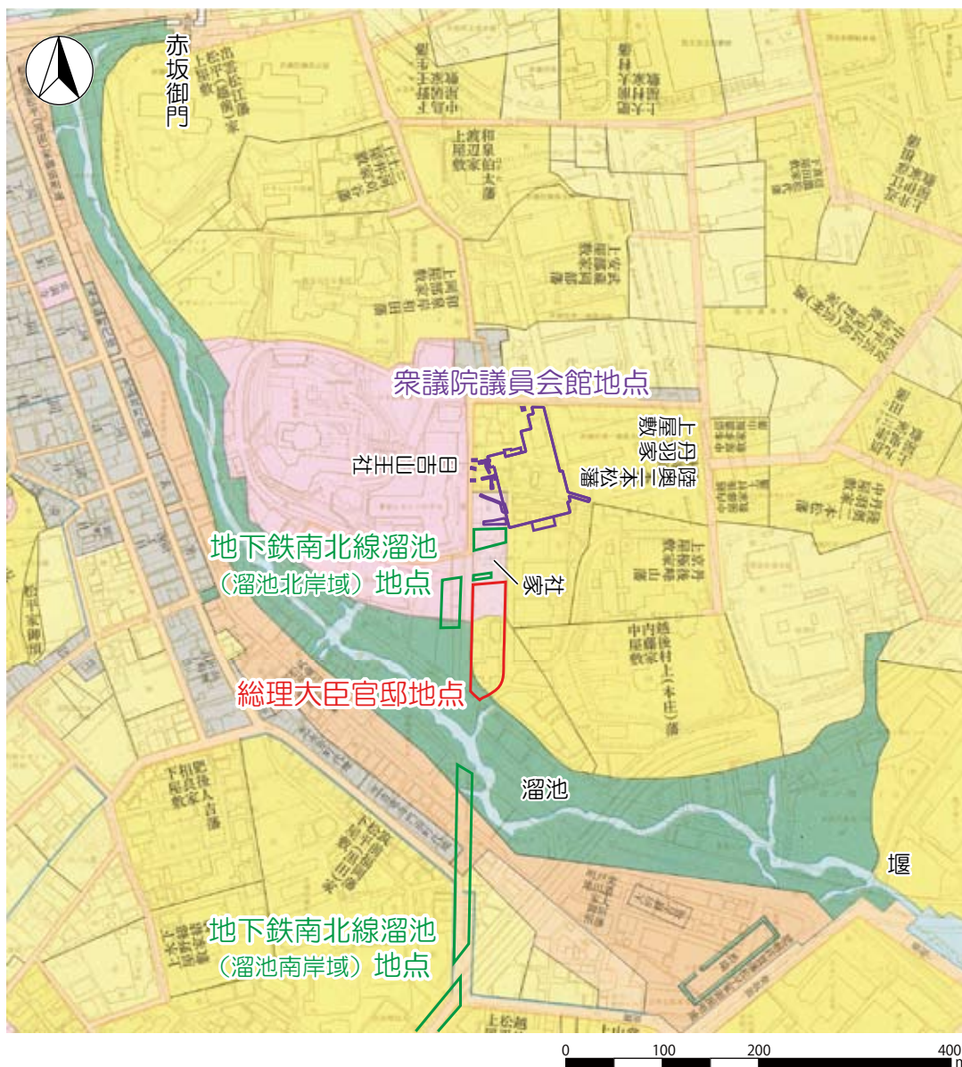
6 溜池遺跡の調査地点位置図

一方、丹羽家屋敷の西側の谷を挟んで日吉山王社があります。当初の山王社は、城内にありましたが、慶長9年（1604）には城外の麴町隼町に移り、さらに明暦の大火（1657）により社殿を焼失したため、万治2年（1659）赤坂の松平忠房の邸地に移りました。