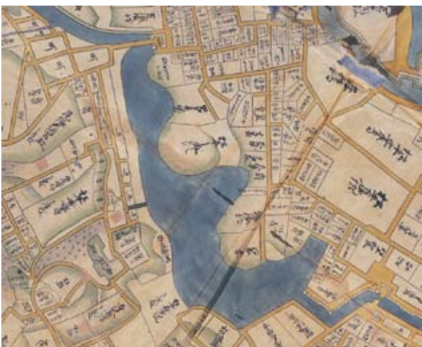
3 寛永江戸全図(部分) 寛永19・20年(1642・43) 白杵市教育委員会所蔵