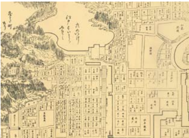
2 武州豊島郡江戸庄図(部分) 寛永9・10年(1632・33)