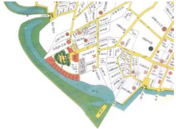
4 尾張屋板「麹町永田町外桜田絵図」(部分) 嘉永3年(1850)