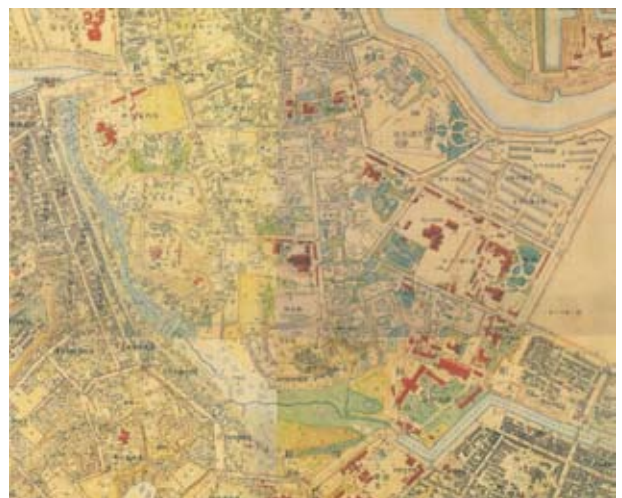
5 五千分一東京図測量原図(部分) 明治16・17年(1883・84) 財団法人日本地図センター