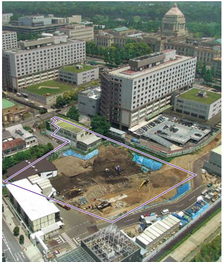
7 調査地点全景（衆議院議員会館地点） 枠線内が調査地点、中央が旧衆議院第一議員会館、右上が国会議事堂