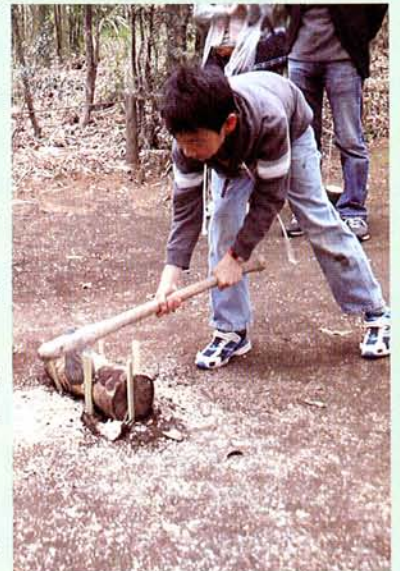
縄文人は大変だっただね。

今年度の年間展示で展示してある銅鐸（レプリカ）を象ったシートを使い、銅鐸に描かれた4種類の図柄のスタンプを集める、というスタイルにしました。