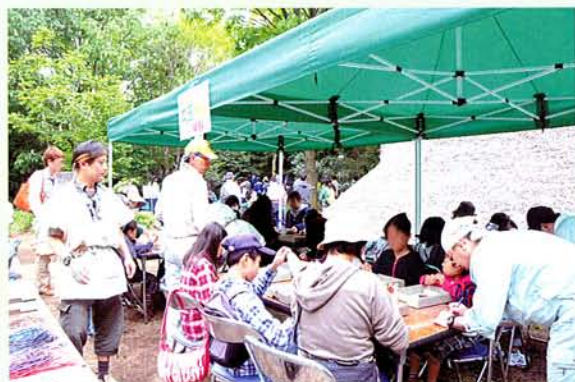
並んで待った甲斐あり！

に並ぶ参加者の方々も見受けられました。きっと素敵な勾玉が出来上がったことと思います。そして、今回、残念ながら出来なかった皆様、ごめんなさい。これに懲りず、来年チャレンジして下さい。お願いします。