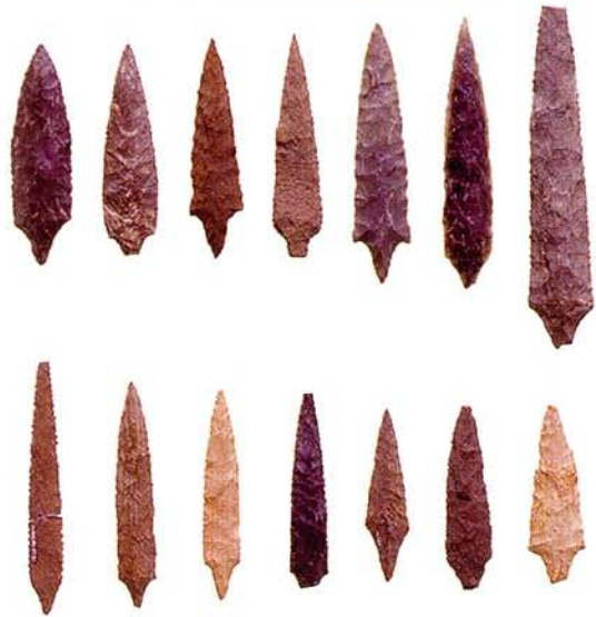
多摩ニュータウン遺跡群から発見された代表的な有舌尖頭器

た事例はなく、民族事例のみによって投槍とされているのが現状である。この有舌尖頭器は、投槍器を使用する投槍の先端に装着する石器である。ただこの石器は、この後に続く縄文時代早期には引き継がれていないのである。つまり、日本において、投槍器を使用する投槍の文化は草創期のみで終わってしまった、と考えられているのである。（並木）