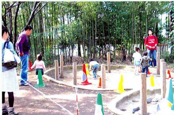
輪投げでイノシシ捕まえられるかな？

今年も各種の体験コーナーと同時開催したスタンプラリー。ただ、今回はちょっと変化をプラス。