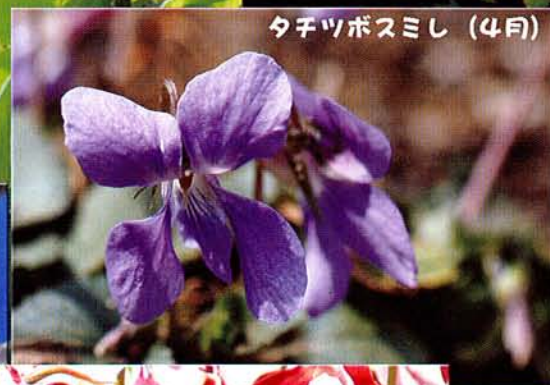
タチツボスミシ (4月)