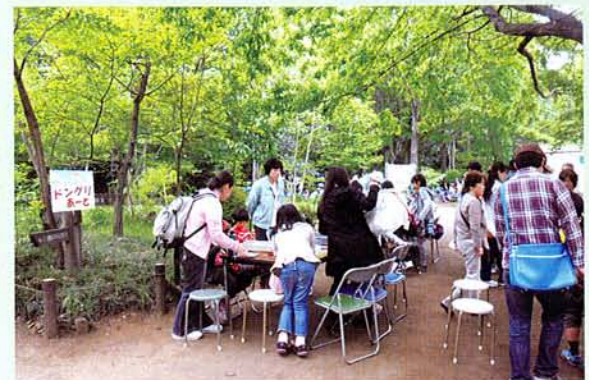
ドングリアート、新緑の中での芸術。

火起こしマークも好評だったのですが、勾玉の図柄は「とてもかわいい」と、さらに好評をいただきました。デザインを担当した職員はうれしかったですよね。