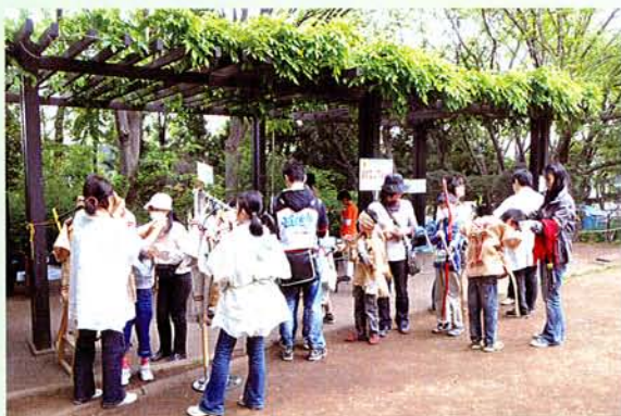
森ガール、山ガールの次は縄文ガールで決まり！

奥へ進むと、復元住居B棟の周りがメインの会場になっています。縄文コレクション、勾玉作り体験、石器作り実演見学、火おこし体験とワクワクメニューが目白押し。中でも皆さんのお目当ては、やはり勾玉作りですよ。