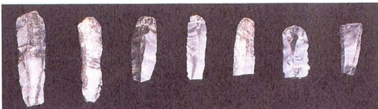
写真 長野県矢出川遺跡出土の細石刃（提供：堤 隆氏 堤 隆 2004『シリーズ「遺跡に学ぶ」2009 氷河期を生き抜いた狩人 矢出川遺跡』新泉社より）