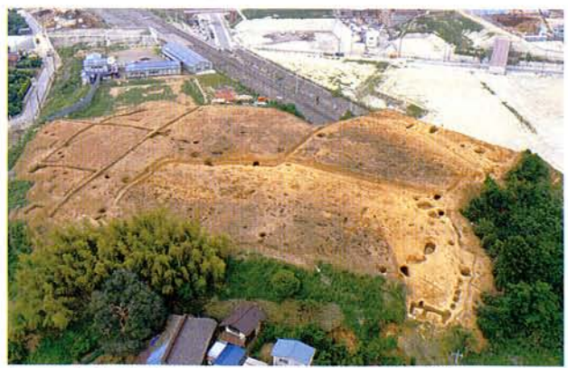
No.457 全景（北西から）中央奥は工事中小田急線