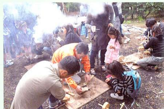
こうして、こうやって、こうやると、ほら…。

昔から「火のない所に煙は立たず」って言いますよね。でも、火おこし体験のコーナーではその諺は通用しないんです。事実、あちこちで煙が出て、もうモクモクです。煙で涙が止まらない人や咳き込んでしまった人、