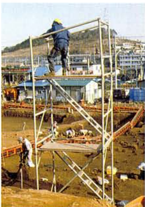
左：写真撮影用足場（参考）