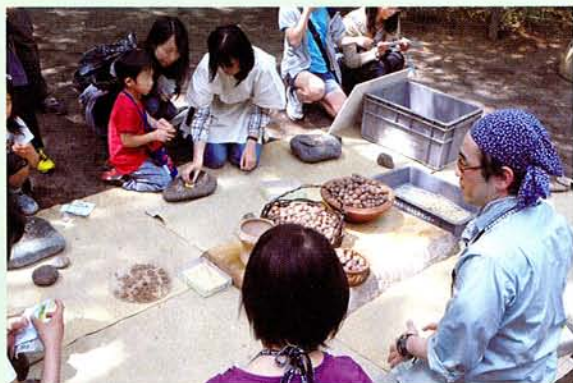
「クルミ、おひとつ割っていかれませんか？」

ちょうど1年前、多摩センターこどもまつりにあわせ、センター創立30周年記念事業として行われたこの行事。縄文ワクワク体験まつりの第2回目が開催されたのです。