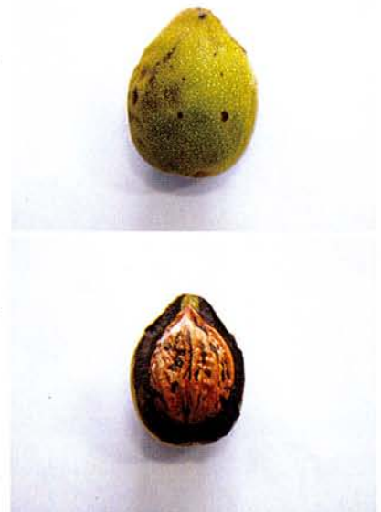
上：この状態で木に生っています。