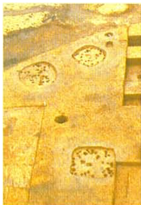
右：縄文時代前期の住居跡