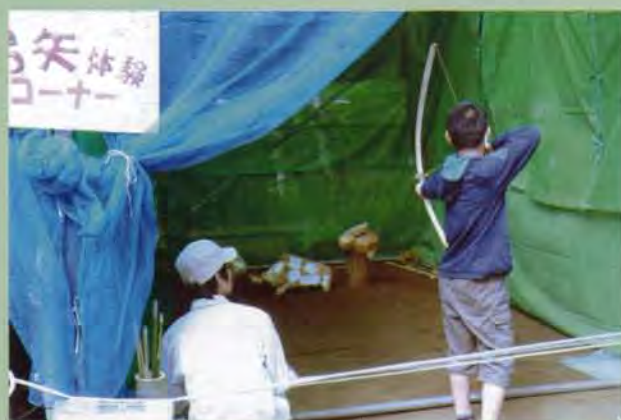
弓矢体験 イノシシにねらいを定め、弓をひきしぼる