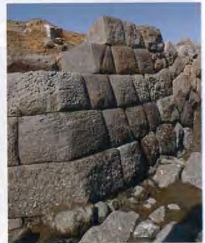
隅角部の石垣【2012年度調査】