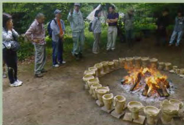
どんな土器に焼けるのでしょうか？ ドキドキッ！！

があります。手前味噌を承知で申しますと、うちは縄文人も使ったブランドものの粘土を使用しています。それは、町田市小山ヶ丘の多摩ニュータウンNo.248遺跡、縄文時代中期の粘土採掘跡が発見された遺跡より採取された粘土をベースに、長年の経験で培った微妙な砂の混ぜ具合による、「作り易く」、「割れにくい」天然素材なのです。この粘土を使って、今年もすでに、一般・親子を対象とした「縄文土器作り」を3度行いました。