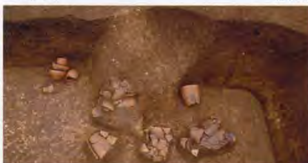
遺物出土状況 [2号住居跡]