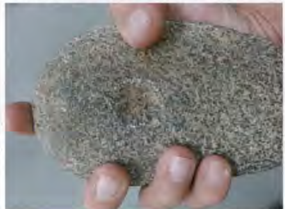
凹石の持ち方と凹みの様子