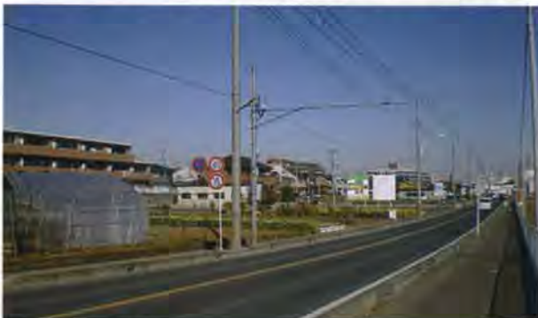
三芳町藤久保東遺跡

小河川は短く、上流のほとんどは水の流れていない浅い谷でしかない。遺跡は、その浅い谷の近くにある。(石器文化研究会 2006『第11回石器文化研究交流会発表要旨』をもとに作成)