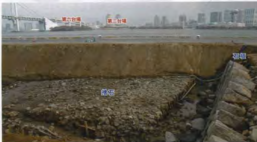
北面の石垣と旧海面下に敷かれた捨石（第三・第六台場を望む）【2012年度調査】

設計・指揮にあたった江川太郎左衛門英龍は、品川沖の「埋立之方ハ手軽に候」と自ら評したように、わずか1年3ヶ月足らずで海上に6基の人工島を完成させました。幕府の威信をかけた一大国家プロジェクトは、在来の土木技術と西洋の築城技法との融合によって成し遂げられたといえるでしょう。品川御台場のほか日本各地の沿岸に築造された千基余りの台場・砲台は、開国へと至る激動の幕末を直接物語る遺構であるとともに、近代日本を切り開く技術の礎につながったことは言うまでもありません。在来の築城・土木技術が幕末まで、そして近代から現代までいかに受け継がれてきたのか、台場の調査を通じて解き明かして行きたいと思います。（大八木）