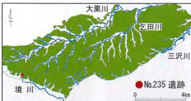
多摩ニュータウンの遺跡