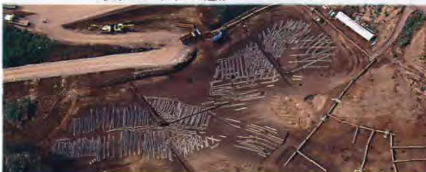
古墳時代の畑跡全景