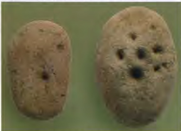
多摩ニュータウンNo.9 遺跡出土の凹石

電子レンジを利用するという現代の知恵から遡って、オニグルミを焚火で炙ってから凹石で割る、なんて方法も試してみる価値はありそうです。(鈴木)