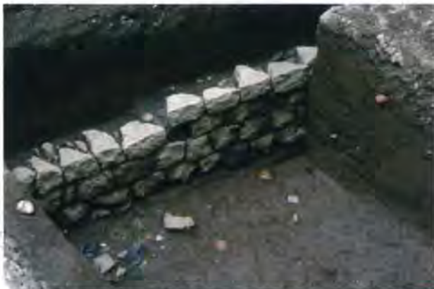
1. 江戸時代の石組遺構