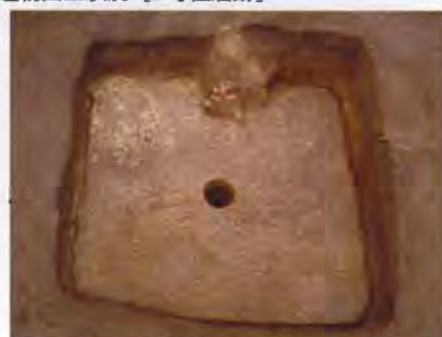
古墳時代の竪穴住居跡 [2号住居跡]