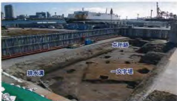
屯所（番士休息所）跡と一文字堤【2011年度調査】

あたり、絵図との照合により、「屯所（番士休息所）」と推定される建物の堅牢な木組み基礎、入口方面からの視界をさえぎる一文字堤、土塁の内法、間知石組の排水溝が検出され、台場内部の施設にかかわる下部構造の様子がはじめて明らかになりました。