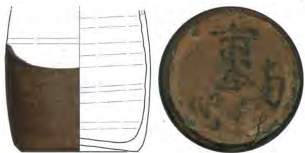
2. 底部に「市谷南寺町」の墨書がある徳利