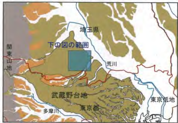
武蔵野台地の地形

武蔵野台地北部の埼玉県側は、南部の東京都側に比べ小河川が少なく起伏の小さい地形をしている。(石器文化研究会 2000『石器文化研究』8をもとに作成)