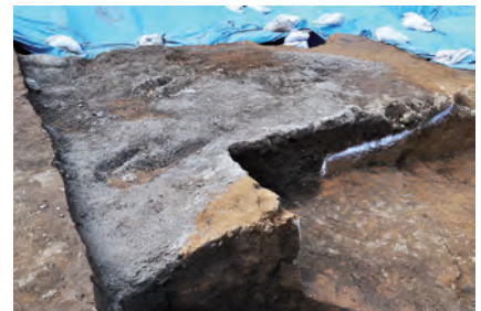
① 砂を貼っているところ（灰色の部分）