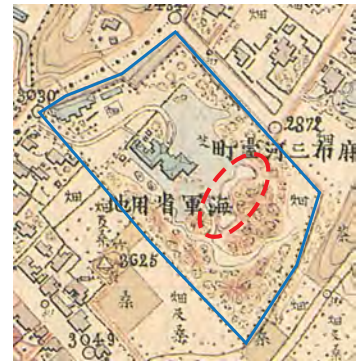
図1 明治初期の調査地（※）