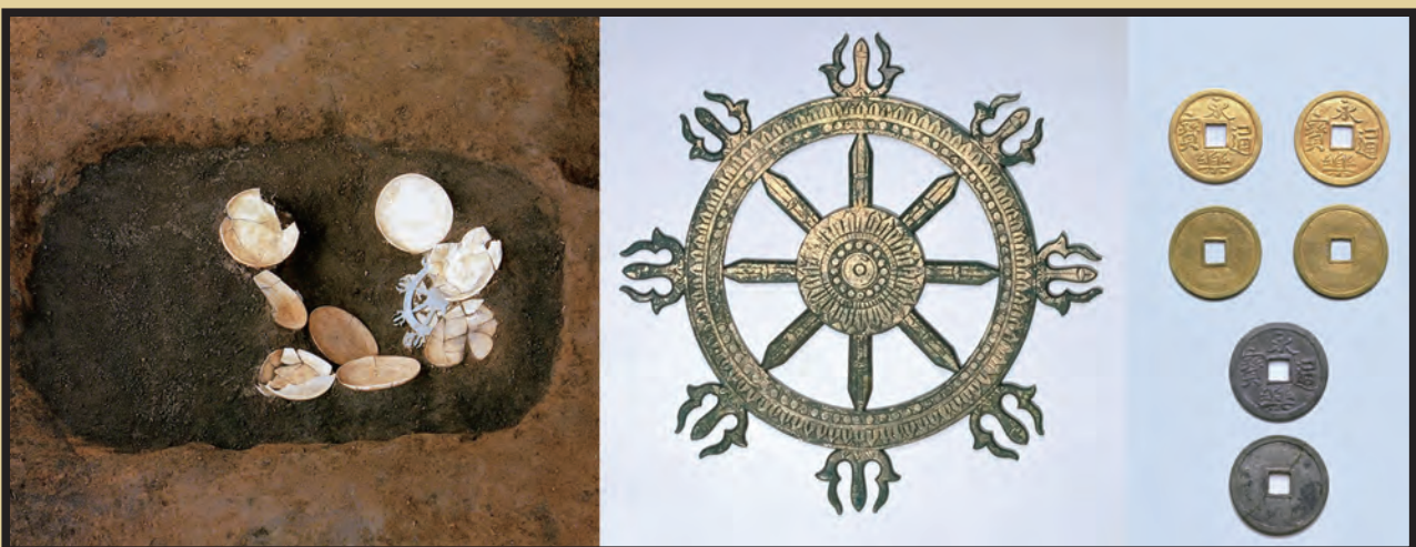
写真2：毛利家屋敷跡から見つかった地鎮遺構（左）、出土した輪宝と金・銀製の永楽通宝銭（右）。この他、寛永通宝銭やカワラケ（土器皿）が出土した。カワラケに墨書で輪宝を描き、地鎮に利用した例は他にもあるが、実際の製品を伴うものは類例が無い。大名屋敷で行われた地鎮儀礼を知る貴重な考古資料として、東京都指定有形文化財に指定されている。