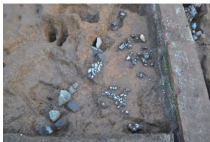
③ 玉石を敷いたところ