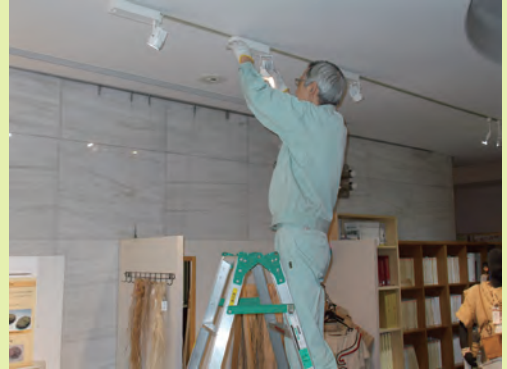
展示ホール内の照明を取り替える

が、建物内の各施設に関するメンテナンス作業も重要な仕事の一つです。メンテナンス対象としてはまず、照明器具が挙げられます。特に展示ケース内の照明に関しては、細心の注意が必要とすることでした。それから、トイレの水漏れや排水施設の不具合などの早期発見も重要な仕事の一つです。専門業者が来るまでの間、応急の手当もしなければなりませんし、当然、その知識も必要となります。