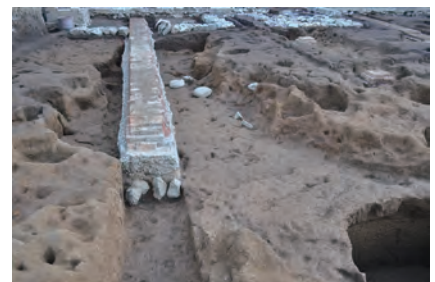
④ 連続する筋状の掘り込み