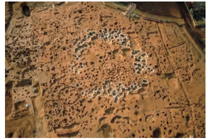
環状の墓墳群（縄文時代）

ここで少し展示の内容にふれておきます。江戸時代、室町時代、弥生時代、縄文時代のコーナーでは、それ