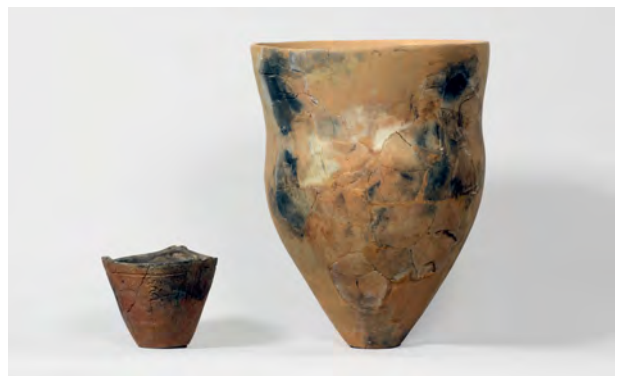
写真2 復元された縄文時代後期の土器

本遺跡では住居跡は発見されず、縄文時代後期の土器片が出土した周辺では石を焼いた集石が多数発見されました。このような深鉢が持ち込まれていることから煮炊きのような作業でもしていたのでしょうか。本遺跡は三沢川の水源地でもあり、水にも恵まれている環境にあります。平尾遺跡のような大きな集落からこの急峻な丘陵地域に赴いて、狩や採集で得られた食物加工などの作業を行った遺跡の一つであったのかもしれませんが。(比田井民子)