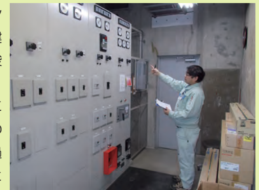
各計測機器の数値を記録する

当然、施設の老朽化は避けられない問題ですが、そのような状況のなかであって、設備係の人たちは、職員や来館者が施設内で安全で快適に過ごせるよう、日々目を光らせています。(福田敏一)