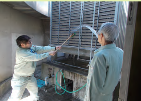
屋上の冷却装置を掃除する

当センターの冷暖房は、すべてこのバルブの開閉によって行われます。使用可能な電力量が決められているので、全部屋の冷暖房を一度に使うことは出来ません。ここが設備系の腕の見せ所であるとともに気を遣う部分で、来館者や職員に快適に過ごしてもらうために、各部屋の温度や湿度は1時間おきに計測しています。