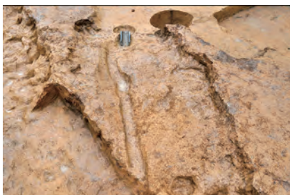
② 瓦を転用した樋状の溝

調査区の中央に、大きく広がっている様子が確認されました。最も深い部分で80cmほどですが、当時はもう少し深かったものと考えられます。