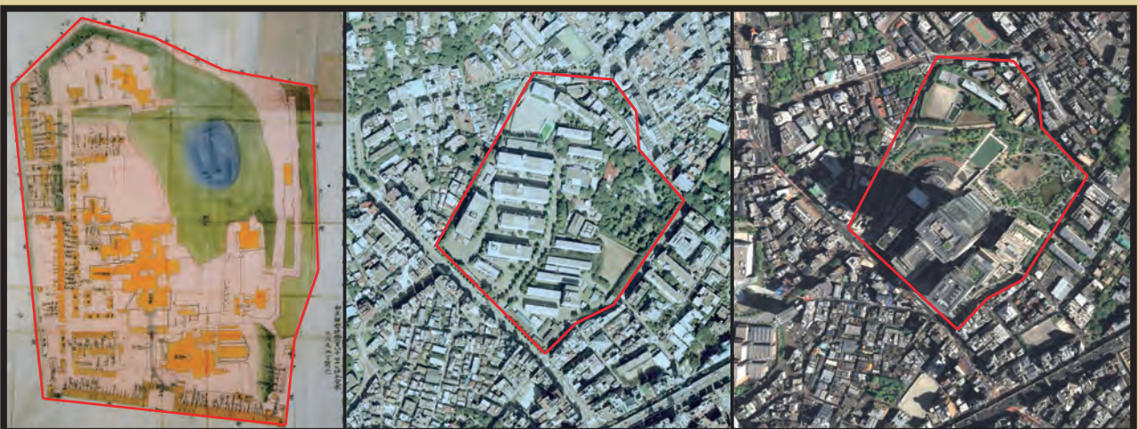
写真1：江戸時代の麻布屋敷が描かれた「麻布御屋敷差図」（山口県文書館所蔵）（左）、1992年（中）と2009年（右）の空撮写真。萩藩の麻布下屋敷は、幕末の第一次長州征伐時に幕府に引き渡され更地となった。明治維新後、この地は陸軍用地となり、歩兵第1連隊、近衛師団が配置された。戦後米軍から返還され防衛庁の施設として利用されていた。

遙か昔、特別な道具で鎮められた土地の上に、都内屈指の高層ビルが建っていることに、時代を超えた不思議な縁を感じてしまいます。（武内 啓）