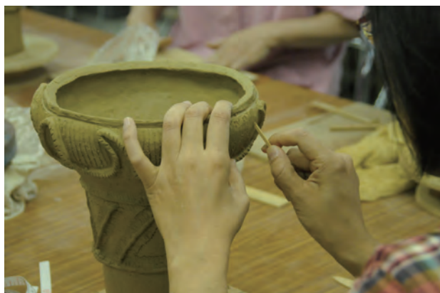
「本物をお手本に・・・縄文人に近づけるかな？」

各地の博物館施設でも土器作り体験が行われていますが、当センターの土器作りは、ひと味もふた味も違います。まずお手本が特別で、多摩ニュータウン遺跡から出土した本物の縄文土器をモデルに土器作りを行います。普段なかなか触れることのできない本物の縄文土器ですが、この時ばかりはしっかりと見て触れて、縄文時代の人達の技術を体感してください。使用する粘土も特製で、当センターのオリジナル。実は縄文時代の人々が実際に使用した粘土が遺跡から見つかっており、この粘土を使っているのです。作った土器は野焼きで焼き上げます。窯では出ない自然の焼ムラがいい味を醸し出してくれます。全てが「本物」にこだわった土器作りです。