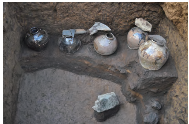
268号地下室から見つかった5個の壺。床に置いたのではなく、中に土が50cmほどたまった後に、並べて置いたようです。壺の上には、石や瓦が蓋代わりに置かれていました。