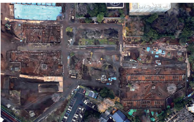
調査区全景（2013年12月20日撮影）