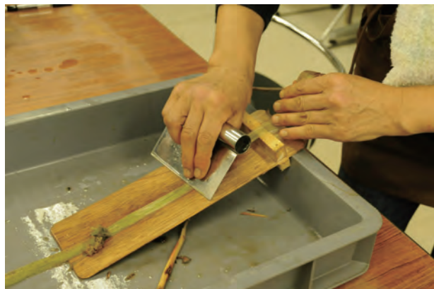
「古代人も使った糸をカラムシから作ろう！」