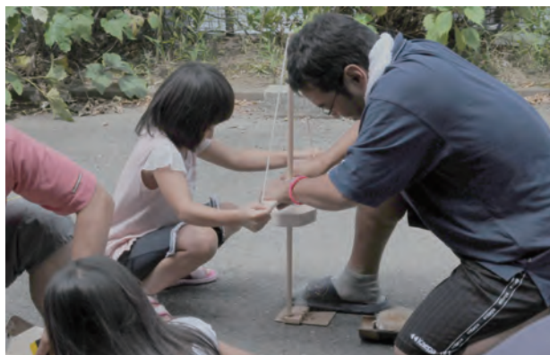
「親子で火おこしにチャレンジだ！」

当センターでは、7月から3月までの平日に火おこし体験が出来る、「火おこしマイスター」を実施してまいりました。「それならわざわざ応募しなくても…」と思われるかもしれませんが、この教室では、何と火おこし道具（舞ぎり）を自分で組み立て、持ち帰ることが出来るのです。自画自賛になりますが、当センター製作の舞ぎりは優秀で、着火率がとても高いのです。この機会に、自分だけの火おこし道具を手に入れてみませんか。