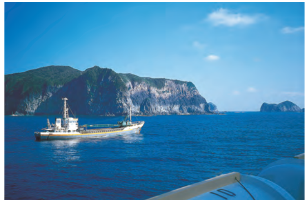
神津島の黒曜石産地

日本列島の遺跡 日本列島を見渡しますと、関東平野に遺跡が集中して平野に遺跡が多いのは明瞭ですが、九州山地や信州地方、飛騨地方のように山間部の様々な地形