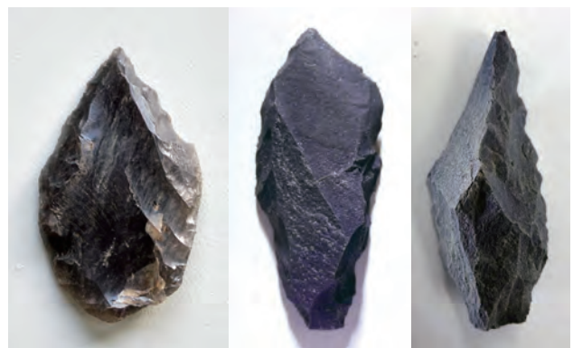
旧石器時代の石器（左：尖頭器 中央・右：ナイフ形石器）

調査は現在進行中です。これからどのような遺構、遺物が発見されるのか期待されます。（並木 仁）