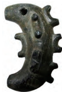
祭祀用の子持勾玉 (足立区教育委員会所蔵)

また、土偶や石棒などは、人が何かを期待して作る「第二の道具」とも呼ばれます。現代人からすると非生産的な道具ですが、縄文人にとっては、きわめて重要な役割を果たしていたことがわかります。