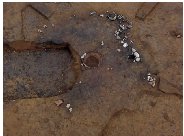
縄文時代中期の住居跡（中央に埋甕炉、上方に伏甕が見える）