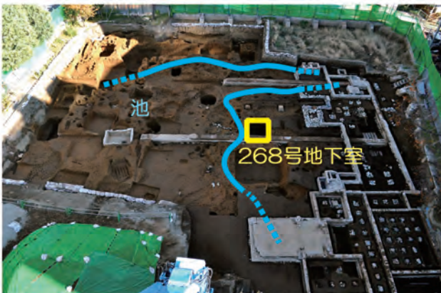
旗本花房家屋敷跡遺跡（部分／上空から） 調査区の北側に庭園の池が広がり、そのすぐそばで268号地下室が発見されました。

発見時の状況や、壺が全く欠けていないところから見ても、誰かが何らかの意図を持って黒色火薬を中に詰め、この穴の中に置いたものと考えて差し支えないでしょう。しかし、黒色火薬は湿気を吸ってしまうと火付きが悪くなり、燃えにくくなってしまいます。それなのになぜ、わざわざ湿気の多い地下室にきちんとした蓋もせず置いたのか、疑問が残ります。また、そもそもなぜ黒色火薬を準備したのか、それが花房家とどのような関わりがあつたのかなど、多くの謎があります。これらを解明するには、もう少し時間がかかりそうです。（内野 正・合田恵美子）