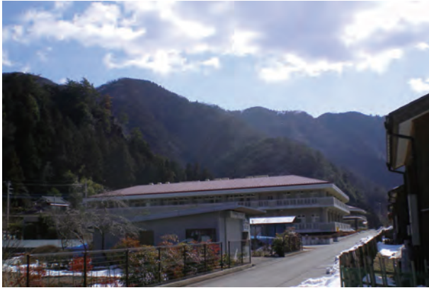
奥多摩町下野原遺跡

平野が続く東京とは異なり、山あいの地域では川沿いのあまり広くない段丘上を住まいにして、山中から川までの多様な資源を求めて、川の上流から下流まで長い距離を季節的に移動しながら暮らしていたと考えられます。 (伊藤 健)