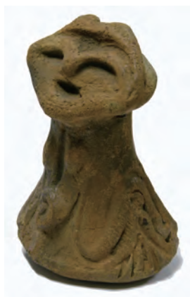
祈りの土鈴形土偶 (八王子市教育委員会所蔵)

ここで、今回の企画展示の見どころについて、ほんの少し、かいつまんでお話してみたいと思います。